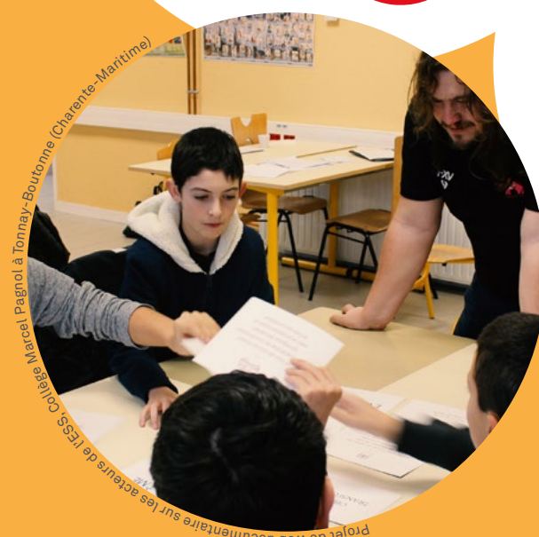
Projet de web documentaire sur les acteurs de l'ESS Collège Marcel Pagnol à Tonnay-Boutonne (Charente-Maritime)

« Mon Entreprise Sociale et Solidaire à l'École » consiste en la création, en classe, d'une entreprise de l'Économie Sociale et Solidaire par des collégiens et des lycéens. La démarche de « Mon ESS à l'École » a pour vocation de faire des jeunes des acteurs à part entière d'un projet entrepreneurial, collectif et d'utilité sociale.