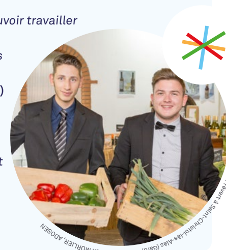
Drive fermier, Lycée Jacques Prévert à Saint-Morlier, ADOSEN

Isabelle, principale d'un collège (Direction, mars 2018)